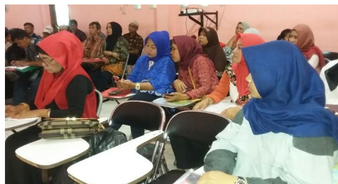
Gambar 4: Perhatian Peserta

Besarnya minat peserta untuk lebih memahami tentang pengelolaan keuangan di Lembaga Keswadayaan Masyarakat (LKM) Wilayah Tim 8 KOTAKU Palembang, sehingga perhatian yang besar diberikan saat penyampaian materi diberikan.