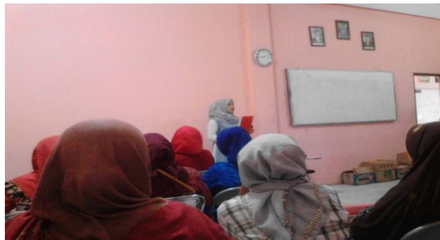
Gambar 1: Pembukaan Acara

Pembukaan acara dilakukan oleh panitia penyelenggara dengan memberikan beberapa sambutan berkenaan dengan persiapan dan pentingnya kegiatan ini diadakan bagi Lembaga Keswadayaan Masyarakat (LKM) Wilayah Tim 8 KOTAKU Palembang.