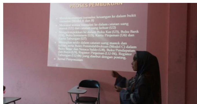
Gambar 3: Pemaparan Materi Proses Pembukuan

Penyampaian materi dilanjutkan dengan pembahasan proses pembukuan yang harus dilakukan