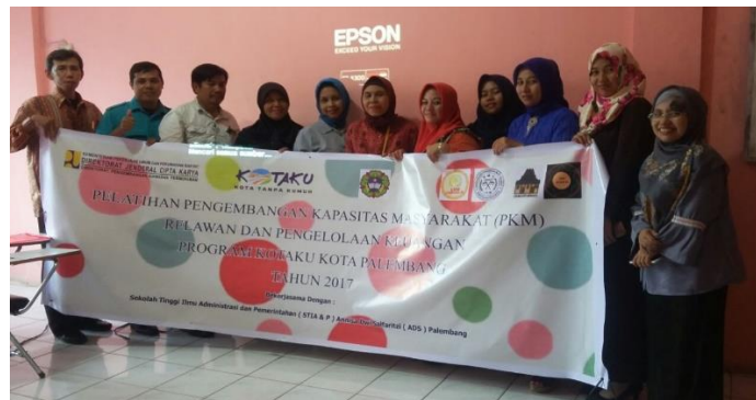
Gambar 6 : Foto Bersama dengan Peserta

Terakhir acara ditutup dengan foto bersama antara pemateri dan Lembaga Keswadayaan Masyarakat (LKM) Wilayah Tim 8 KOTAKU Palembang.