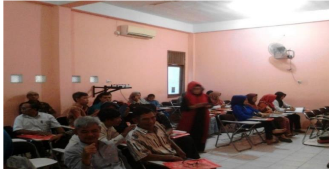
Gambar 5: Sesi Tanya Jawab

Session tanya jawab diberikan untuk membuka kesempatan bagi peserta untuk lebih dapat memahami materi yang disampaikan.