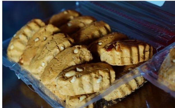
Bagea yang hanya dikemas dengan plastik tanpa Label dan Brand

Bagea adalah makanan yang terlihat sederhana namun memiliki tahapan proses pembuatan yang cukup rumit dan lama. Hal pertama yang perlu dipersiapkan dalam membuat Bagea adalah bahan-bahan yang diperlukan untuk membuat adonan. Bahan dasar utama adalah tepung sagu, kacang, kenari atau wijen, gula, air, minyak sayur, dan beberapa rempah seperti cengkih dan kayu manis yang sudah ditumbuk halus. Selanjutnya, semua bahan ini dijadikan satu dan diolah menjadi satu adonan dan memerlukan waktu yang agak lama untuk mengaduknya agar semua bahannya tercampur dengan rata karena akan mempengaruhi kualitas hasil jadinya.