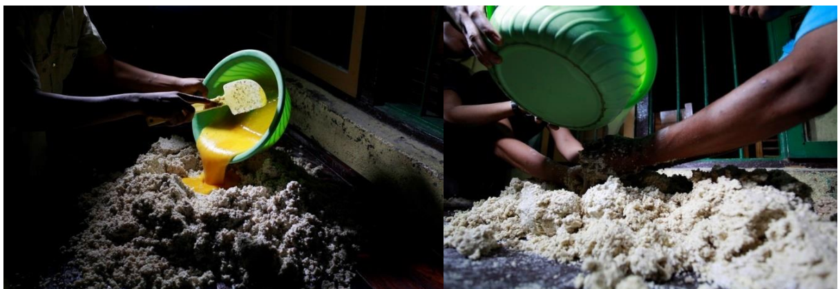
Proses pencampuran bahan dan pembuatan adonan Bagea

Bagea adalah makanan yang terlihat sederhana namun memiliki tahapan proses pembuatan yang cukup rumit dan lama. Hal pertama yang perlu dipersiapkan dalam membuat Bagea adalah bahan-bahan yang diperlukan untuk membuat adonan. Bahan dasar utama adalah tepung sagu, kacang, kenari atau wijen, gula, air, minyak sayur, dan beberapa rempah seperti cengkih dan kayu manis yang sudah ditumbuk halus. Selanjutnya, semua bahan ini dijadikan satu dan diolah menjadi satu adonan dan memerlukan waktu yang agak lama untuk mengaduknya agar semua bahannya tercampur dengan rata karena akan mempengaruhi kualitas hasil jadinya.