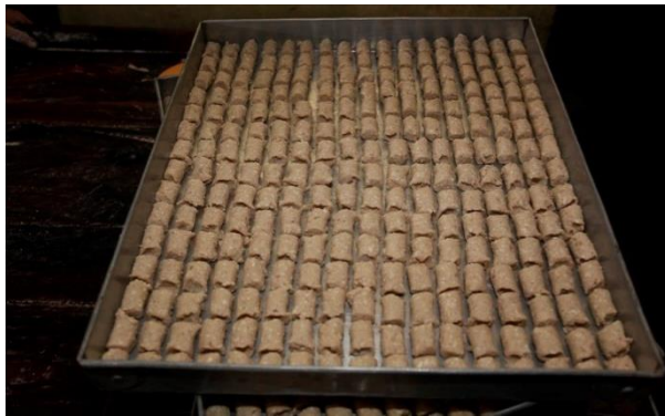
Kue Bagea sebelum di Oven

oleh-oleh saat berkunjung ke Kota Palopo. Bagea yang berbahan dasar tepung sagu ini, memiliki berbagai macam rasa seperti kenari, kacang dan wijen. Kue Bagea umumnya dinikmati dengan ditemani secangkir kopi atau teh hangat. Rasanya yang gurih serta tidak terlalu manis membuat terasanya renyah di mulut.