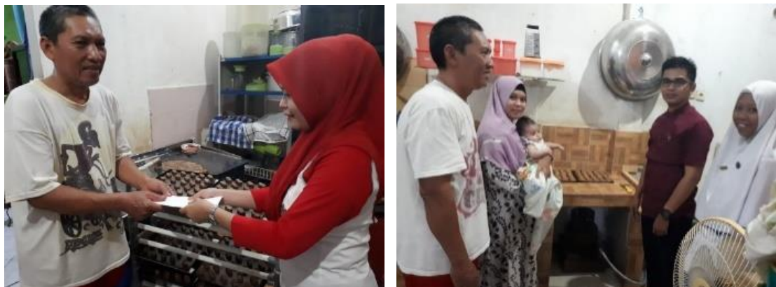
Penyerahan bantuan stimulus modal kepada masing-masing pemilik Home industry Bagea Sehati dan Bagea Surya

Pelatihan kepada mitra dilakukan selama 2 hari yang dilaksanakan di pusat produksi penjualan Bagea Sehati dan Bagea Surya yang terletak di Kelurahan Dangerakko karena memiliki peralatan yang cukup memadai untuk mentransfer teknologi tepat guna yang berkaitan dengan Bagea . Kegiatan pelatihan diikuti oleh karyawan dan pemilik Pusat produksi penjualan Bagea dengan melibatkan masyarakat sekitar. Materi yang diberikan adalah (1) pelatihan manajemen usaha, (2) pelatihan produksi, (3) pelatihan administrasi dan (4) pendampingan. Semua metode ini merupakan satu kesatuan dari program PKM ini. Tim Program PKM menyisihkan dana masing-masing sebesar Rp. 8.000.000,- untuk memotivasi mitra agar bergairah dan bersemangat dalam menjalankan usahanya.