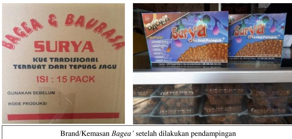
Brand/Kemasan Bagea' setelah dilakukan pendampingan

Dengan pendanaan dari Program PKM, Home industri Bagea' juga diberikan bantuan peralatan sederhana berupa alat-alat produksi dan vakum untuk ketahanan produk dalam kemasan. Kemasan yang dibuat saat ini sudah memenuhi aspek penting dalam pemasaran yang mencantumkan nama brand, rasa, berat, rasa, alamat pemesanan, dan nilai estetik lainnya yang dapat menarik konsumen.