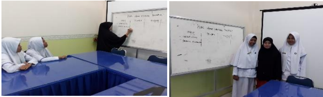
Pembekalan Mahasiswa dan Penyusunan Program PKM Bagea