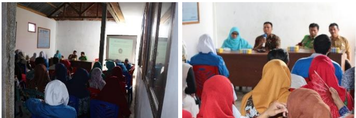
Focus Group Discussion (FGD) dan Sosialisasi Program Pengabdian Kepada Masyarakat (PKM) di Aula Kantor Kelurahan Dangerakko