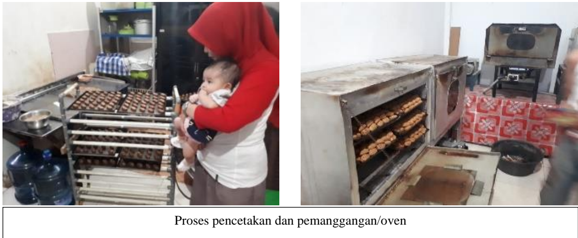
Proses pencetakan dan pemanggangan/oven

mencetak bagea ini umumnya terlihat sangat cepat dan terampil ketika mencetak adonan menjadi kepingan kecil. Setelah semua adonan tercetak di loyang, maka loyang-loyang tersebut siap dimasukkan ke dalam oven besar dengan suhu yang sudah diatur tingkat panasnya. Uniknya, dalam pembuatan bagea diperlukan beberapa kali tahapan memasak di dalam oven hingga akhirnya mendapatkan kue kering Bagea, dalam proses inilah, kekerasan kue kering bagea dapat diatur, semakin sering masuk ke dalam oven, maka bagea akan semakin keras.