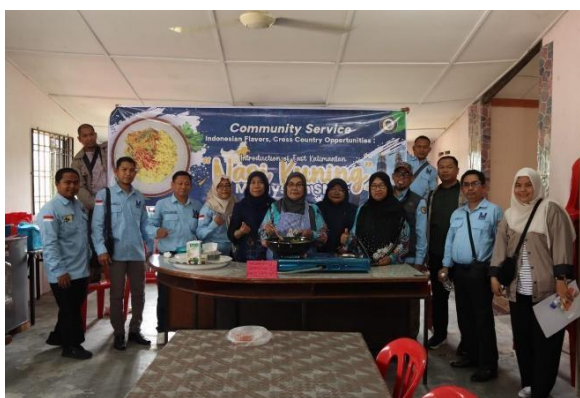
Gambar 2. Perkenalan dan Jejaring

Tahap kedua adalah praktik pembuatan produk. Narasumber memandu peserta memasak Nasi Kuning bersama. Tahap ini dilakukan untuk memperdalam teknik memasak agar makanan yang dihasilkan otentik seperti di daerah asalnya. Tahap ketiga adalah diskusi interaktif. Narasumber memfasilitasi sesi tanya jawab. Narasumber mengajak peserta bertukar pikiran mengenai strategi pengembangan bisnis lintas negara. Narasumber merekam seluruh rangkaian kegiatan melalui dokumentasi.