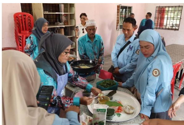
Gambar 3. Praktik Pembuatan Produk

Tahap kedua adalah praktik pembuatan produk. Narasumber memandu peserta memasak Nasi Kuning bersama. Tahap ini dilakukan untuk memperdalam teknik memasak agar makanan yang dihasilkan otentik seperti di daerah asalnya. Tahap ketiga adalah diskusi interaktif. Narasumber memfasilitasi sesi tanya jawab. Narasumber mengajak peserta bertukar pikiran mengenai strategi pengembangan bisnis lintas negara. Narasumber merekam seluruh rangkaian kegiatan melalui dokumentasi.