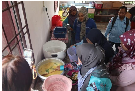
Gambar 4. Diskusi Penyesuaian Rasa

Pendekatan kewirausahaan ini memastikan keterampilan memasak memberikan dampak ekonomi yang nyata. Langkah ini menjadi fondasi awal untuk membangun kemitraan bisnis antara pelaku usaha Indonesia dan Malaysia. Pendekatan ini dilakukan sebagai upaya meningkatkan potensi ekonomi kreatif melalui penguatan tata kelola usaha, peningkatan wawasan kewirausahaan, produktivitas, dan strategi pemasaran (Rahayu et al., 2022). Kuliner juga memainkan peran strategis dalam pemberdayaan ekonomi dengan menjaga memori budaya, memperkuat identitas kolektif, dan mempromosikan rantai nilai yang berkelanjutan. Mengintegrasikan pengetahuan lokal dan partisipasi masyarakat ke dalam inisiatif kuliner memastikan keberlanjutan jangka panjang dan ketahanan ekonomi (Garcia & Araque, 2025).