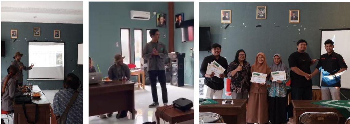
Gambar 10. Pelatihan dan Penyerahan Hadiah Lomba

Kegiatan pengabdian selain pembuatan media visual branding , juga pelaksanaan pelatihan “Memanfaatkan Media Sosial Instagram sebagai Alat Promosi Potensi Wisata Desa”. Peserta pelatihan adalah pengelola media sosial pokdarwis dan destinasi wisata di Desa Wisata Among Kisma. Peserta dibekali dengan pengetahuan kegunaan media sosial untuk promosi desa wisata, menyusun konten promosi, lalu teknis pendampingan pembuatan konten foto, grafis, dan video promosi. Pada akhir pelatihan diadakan lomba pembuatan konten bekerja sama dengan Kalurahan Bandung untuk proses penjurian dan pemberian hadiah.