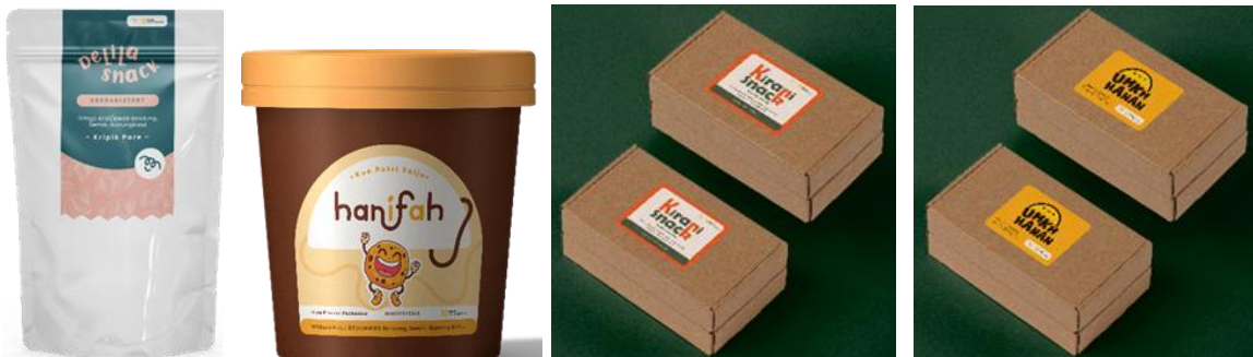
Gambar 8. Label Kemasan UMKM

Logo dan penerapannya pada laber kemasan ini dibuat untuk UMKM yang tergabung pada Desa Preneur Padharasa di Desa Wisata Among Kisma, dengan harapan mampu memberi identitas visual yang kuat, mudah diingat dan memberikan informasi yang jelas.