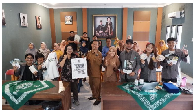
Gambar 11. Sarasehan Penyerahan Karya Branding