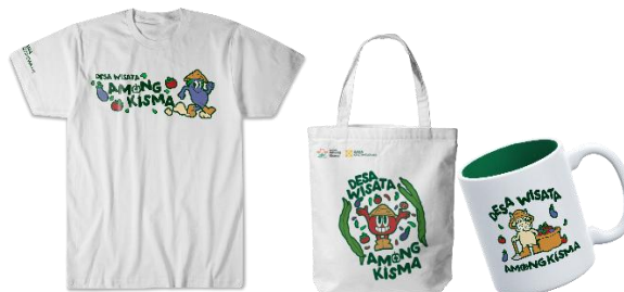
Gambar 4. Merchandise

Merchandise atau cinderamata ini didesain khusus yang mampu diaplikasikan pada berbagai macam media, seperti kaos, mug, tas, gantungan kunci, stiker, sebagai media promosi yang mudah diingan wisatawan karena bisa dipakai dan dibawa pulang.