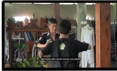
Gambar 5. Video Profil Wisata Budaya

Video profil ini dibuat khusus untuk destinasi wisata budaya yaitu Sanggar Bale Kinasih. Hal ini dikarenakan, wisata budaya ini merupakan salah satu kekhasan yang dimiliki Desa Wisata Among Kisma, dimana wisatawan bisa belajar gamelan dan tarian tradisional.