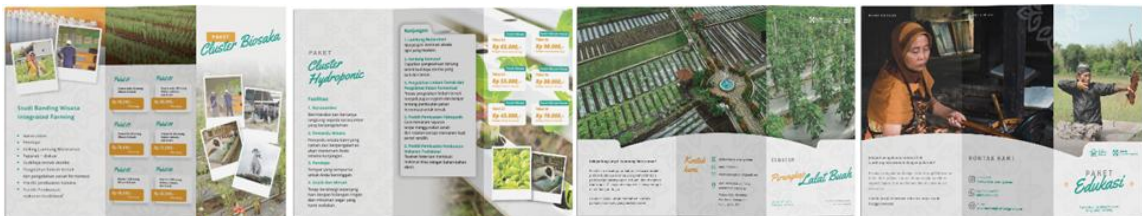
Gambar 3. Brosur Paket Wisata

Brosur ini merupakan penawaran paket wisata minat khusus, yang bisa dibagikan kepada wisatawan maupun calon wisatawan pada saat kegiatan promosi, bahkan bisa juga menjadi informasi di media sosial.