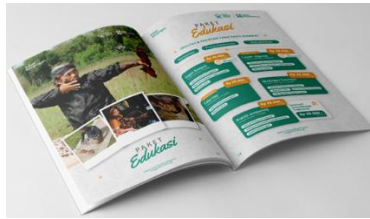
Gambar 2. Buku Paket Wisata

Buku ini merupakan kumpulan atau katalog paket wisata yang ditawarkan oleh Desa Wisata Among Kisma, yang bisa digunakan oleh pemandu wisata saat melakukan penjelasan kepada wisatawan.