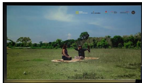
Gambar 1. Video Profil Desa Wisata Among Kisma

Video profil ini menyampaikan secara keseluruhan potensi wisata di Desa Wisata Among Kisma. Penyampaian visual dan informasi pada video profil ini dibuat supaya penonton memahami dengan seolah-olah mengalami langsung pengalaman berwisata di sana, dengan standar video untuk ajang penghargaan Anugerah Desa Wisata Indonesia (ADWI). Video ini menjadi visual yang mampu dipertontonkan dalam kegiatan apapun di Desa Wisata Among Kisma, bahkan bisa menjadi cikal untuk kepesertaan lomba ADWI.