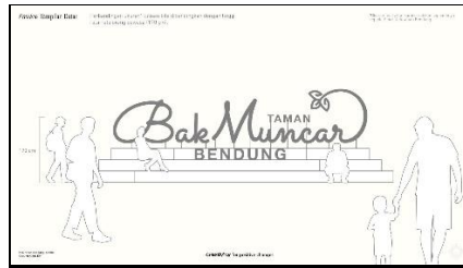
Gambar 9. Landmark Bak Muncar

Kegiatan pengabdian selain pembuatan media visual branding , juga pelaksanaan pelatihan “Memanfaatkan Media Sosial Instagram sebagai Alat Promosi Potensi Wisata Desa”. Peserta pelatihan adalah pengelola media sosial pokdarwis dan destinasi wisata di Desa Wisata Among Kisma. Peserta dibekali dengan pengetahuan kegunaan media sosial untuk promosi desa wisata, menyusun konten promosi, lalu teknis pendampingan pembuatan konten foto, grafis, dan video promosi. Pada akhir pelatihan diadakan lomba pembuatan konten bekerja sama dengan Kalurahan Bandung untuk proses penjurian dan pemberian hadiah.