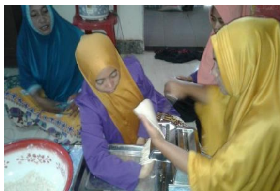
Gambar 5. Proses Pelempengan dan Pemipihan