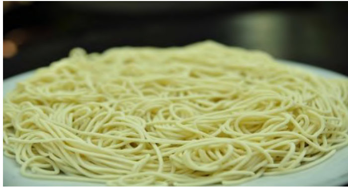
Gambar 6. Mi Rumput Laut Siap Konsumsi