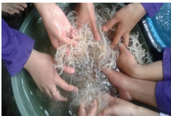
Gambar 2. Proses Perendaman