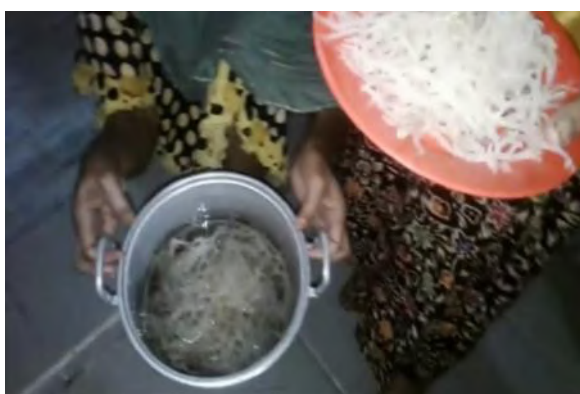
Gambar 4. Proses Pengukusan