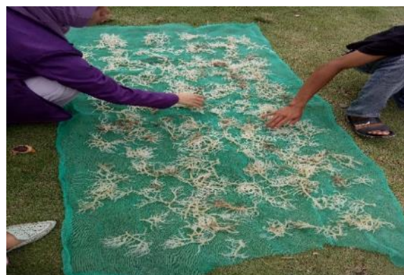
Gambar 3. Proses Pengeringan