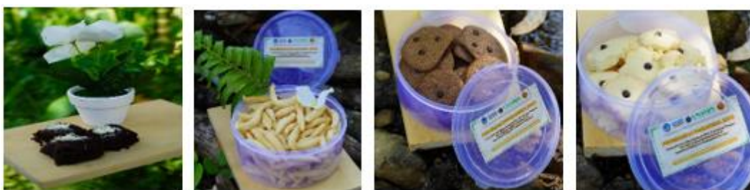
Gambar 4. Aneka Kue Berbahan Baku Sagu

Dari hasil pelatihan dan demonstrasi yang dilakukan pada kelompok PKK di Kampung Baingkete tersebut menghasilkan aneka kue, yang nantinya diharapkan dapat menambah ketrampilan kelompok PKK dan dapat memberdayakan kearifan lokal maupun dapat meningkatkan ekonomi pada masyarakat. Hal ini sesuai dengan pendapat Sari (2018), Sagu merupakan komoditas utama yang memiliki potensi sebagai sumber karbohidrat. Sagu dapat difungsikan sebagai alternatif pangan, baik dalam bentuk papeda sebagai pangan pokok maupun dalam berbagai bentuk lainnya seperti sagu lempeng, sinali, bagea, dan sebagainya. Selain itu, sagu juga dapat dijadikan tepung komposit untuk menggantikan tepung terigu. Pengembangan dan pemanfaatan sagu memiliki peran strategis dalam mendukung serta menjamin ketersediaan pangan. Produk yang dihasilkan seperti pada gambar di bawah ini.