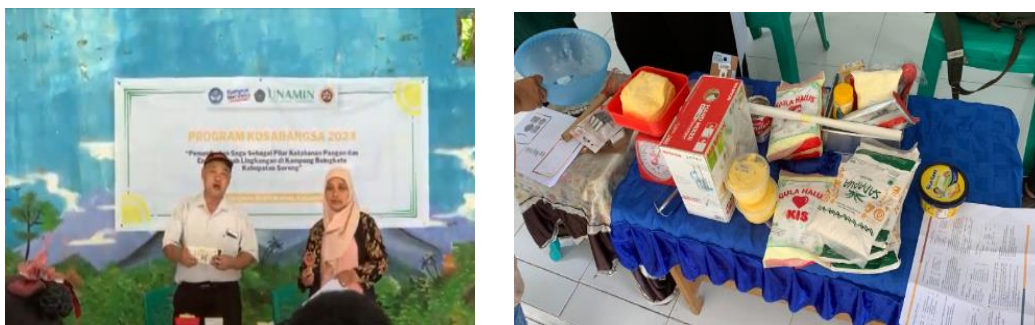
Gambar 2. Pelatihan dan Bahan Kue

Kegiatan pembuatan kue kering berbahan baku sagu ini bahan yang digunakan adalah tepung sagu, telur, mentega, butter, gula halus, coklat bubuk, coklat Batangan, baking soda, choco chip, keju, vanili, minyak goreng dan minyak tanah, sedangkan alat yang digunakan adalah mixer, oven, parutan keju, loyang, cetakan kue, timbangan, wajan dan kompor. Di bawah ini adalah gambar pelatihan.