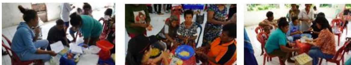
Gambar 3. Proses Pembuatan Aneka Kue

Kelompok PKK di kampung Baingkete rata-rata adalah Suku Moi dengan mata pencaharian sehari-hari adalah petani dan mengolah sagu. Namun karena rendahnya tingkat pengetahuan di kelompok PKK telah menyebabkan keterbatasan dalam mengolah sagu menjadi berbagai jenis makanan. Upaya untuk mengatasi keterbatasan ini perlu adanya pelatihan dan demonstrasi secara langsung pada kelompok PKK tersebut. Proses pengolahan dimulai dengan mengolah tepung sagu basah menjadi tepung kering, dengan setiap tahapan dijelaskan agar masyarakat dapat memahami cara membuat tepung kering sagu yang dapat diolah menjadi berbagai jenis kue. Setelah pembuatan tepung, kegiatan dilanjutkan dengan demonstrasi pembuatan berbagai hidangan atau kue antara lain brownies sagu, kue gabus, chookies sagu coklat, dan chookies sagu keju, disertai dengan pembagian resep kepada masyarakat, khususnya kepada kelompok PKK di Kampung Baingkete. Di bawah ini adalah proses pembuatan aneka kue berbahan baku sagu.