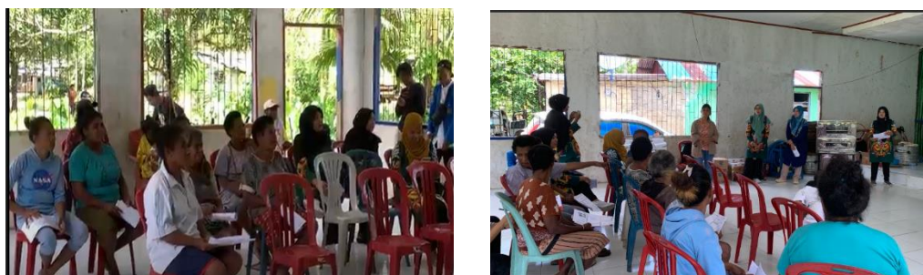
Gambar 1. Sosialisasi Pembuatan Kue Berbahan Baku Tepung Sagu

Sosialisasi pembuatan kue berbahan baku sagu ini untuk meningkatkan kesadaran masyarakat tentang keuntungan ekonomi dan budaya dari penggunaan tepung sagu. Berikut adalah beberapa langkah yang dapat diambil dalam sosialisasi ini: 1).Mengadakan pertemuan dengan kelompok PKK Kampung Baingkete untuk berbagi informasi tentang program sosialisasi. 2). Membangun kemitraan dengan tokoh-tokoh masyarakat setempat untuk mendapatkan dukungan. 3). Memaparkan manfaat penggunaan tepung sagu dalam pembuatan kue. 4). Menyebarkan materi edukasi berupa pamflet dan brosur yang menjelaskan proses pembuatan kue berbahan baku sagu. Serta 5). Menyoroti keunggulan kesehatan dan keberlanjutan lingkungan dari penggunaan sagu. Di bawah ini adalah gambar kegiatan sosialisasi.