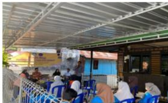
Gambar 2. Sosialisasi Kegiatan