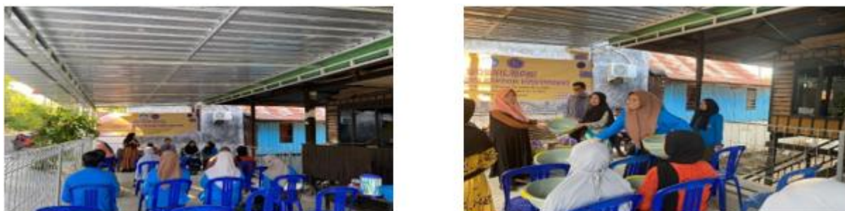
Gambar 3. Pemberian motifasi kerja

Dalam kegiatan PKM ini kami Bersama ketua RW 009, ketua RT. 004 ketua RT. 005 dan ketua Ibu PKK kelurahan Lapadde, memeberikan sambutan sekaligus memotivasi warga dalam melihat potensi diri yang mereka miliki, mengelola alam secara bijaksana serta memotivasi warga dalam memanfaatkan kesempatan yang dimiliki menjadi sesuatu yang bernilai, Memberikan ilmu pengetahuan kepada warga Melalui PKM dan UMKM ARGIAASH diharapkan dapat membentuk jiwa kewirausahaan bertujuan untuk meningkatkan kemandirian Warga sekitar.