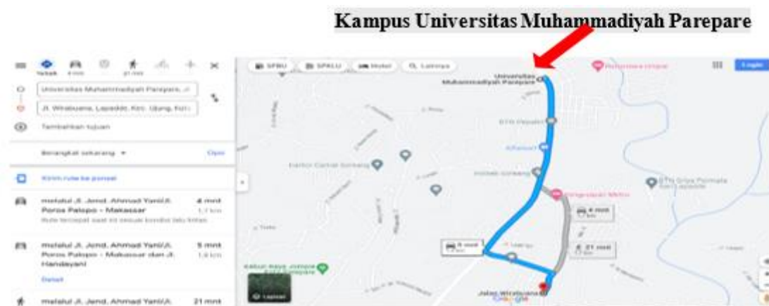
Gambar 1: Peta Lokasi Mitra KELOMPOK USAHA “ARGIASH” Jl. Wirabuana Kelurahan Lapadde Kecamatan Ujung Kota Parepare

keuntungan yang optimal bagi kelompok kelompok usaha “Argiash” yang pada akhirnya akan meningkatkan pendapatan mitra / masyarakat pada Kelurahan Lapadde, Kecamatan Ujung jarak tempuh dari Universitas Muhammadiyah Parepare 1,7 KM dengan tampilan peta lokasi Mitra melalui Google Maps Sebagai berikut: