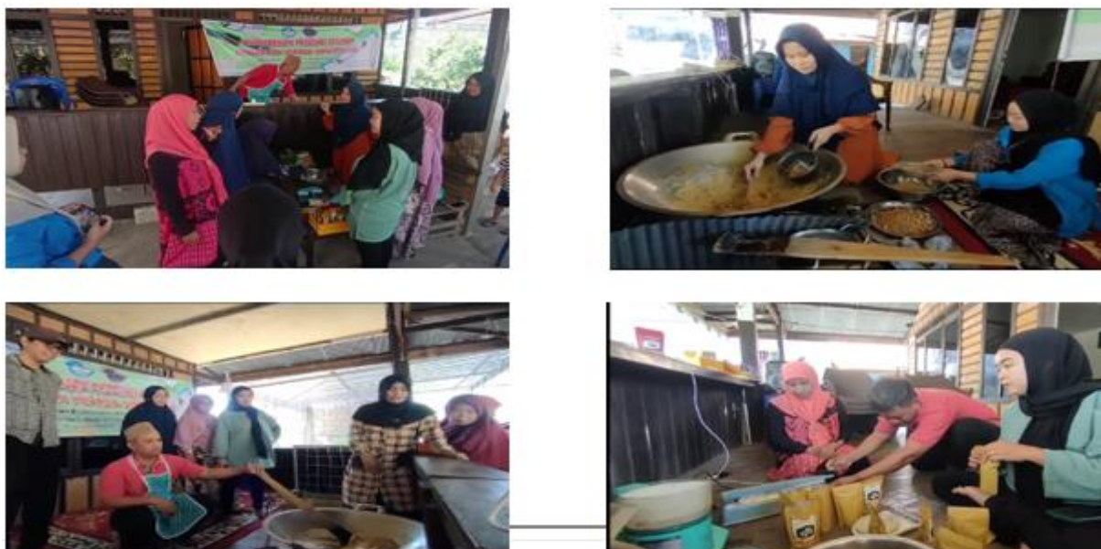
Gambar 6. Pelatihan Keterampilan teknis

Pelatihan keterampilan teknis dapat meningkatkan kapabilitas Mitra UMKM, dan Memberikan peningkatan keterampilan bagi masyarakat sekitar yang dapat mendukung dalam peningkatan nilai ekonomis. Kegiatan PKM ini Iptek yang akan dihasilkan lebih menitik beratkan pada upaya peningkatan pendapatan mitra/masyarakat melalui workshop/pelatihan secara terencana dan terstruktur meliputi peningkatan kapabilitas SDM, kapasitas produksi, pengelolaan keuangan dan strategi pemasaran melalui platform ecommerce berbasis website. Adanya platform ecommerce berbasis website mitra memiliki potensi dalam mengembangkan usahanya melalui pemasaran yang berifat global.