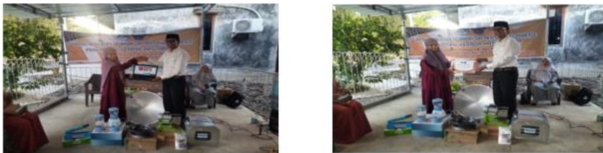
Gambar 5. Introduksi teknologi

Memberikan bantuan peralatan usaha pada UMKM ARGIAH diantaranya: a. Aplikasi ecommerce Argiash, b. Open Higienis, c. Mesin Serut Listrik, d. Stand Pouch, e. Mesin Mixer 3 Tabung, f. Kompor Gas 1 Mata ukuran besar, bantuan peralatan ini diharapkan dapat membantu mitra dalam melakukan peningkatan produksi