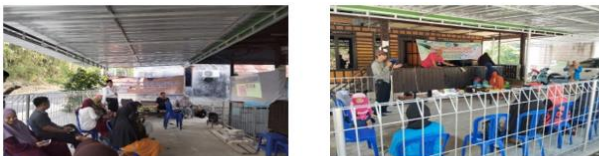
Gambar 4. Pelatihan Kewirausahaan dan pengelolaan keuangan

Kegiatan Pelatihan Kewirausahaan dilaksanakan pada hari Jumat, tanggal 18 Agustus 2023, pada tahap tersebut tim PKM memberikan peningkatan pengetahuan tentang dalam hal pentingya pencatatan keuangan. tahap ini kami menyajikan materi Manajemen keuangan terkait dasar pencatatan hingga pada pengelolaan keuangan, diharapkan agar mitra UMKM dan warga sekitar dapat lebih memahami laporan keuangan. Hal ini tentunya akan ditunjang dengan adanya pecatatan keuangan yang memadai.