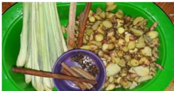
Bahan Baku (Bubuk Herbal minuman Instan )