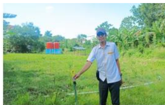
Gambar 1. Kondisi wilayah Kel, Lapadde, Kec, ujung Kota Parepare

berdasarkan Pada awal bulan Maret 2023, pengusul melakukan survey awal pada kelompok usaha tersebut. Usaha bubuk minuman instan Herbal “Argiash” memproduksi bubuk minuman instan herbal diantaranya (1) Bubuk minuman Herbal Instan Jahe Merah dalam kemasan, (2) Bubuk minuman Herbal instan Kunyit putih dalam kemasan (3) Berbuk minuman Herbal instan Temulawak dalam kemasan. Ketiga minuman ini berupa bubuk Minuman Herbal bersifat instan mudah larut dalam air hangat.