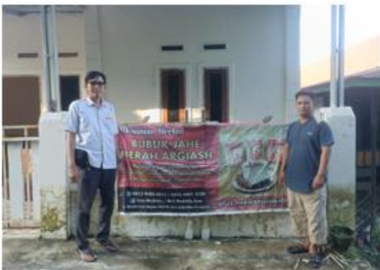
Wawancara dengan Ketua Mitra

Hasil survey awal, ada beberapa kendala yang dihadapi mitra sehingga sulit untuk berkembang, diantaranya adalah : (1) motivasi dan kapabilitas sumber daya manusia pelaku wirausaha home industry masih rendah, (2) tampilan kemasan produk yang masih seadanya serta belum sepenuhnya kepal udara sehingga kurang menarik perhatian konsumen, (4) kurangnya kemampuan dalam pengelolaan keuangan usaha, belum memiliki pembukuan keuangan usaha, (5) sistem pemasaran masih terbatas dan tidak mengoptimalkan pemanfaatan teknologi informasi dalam hal pemodelan ecommerce berbasis website.