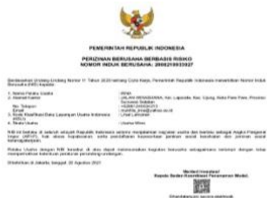
Badan Hukum Mitra