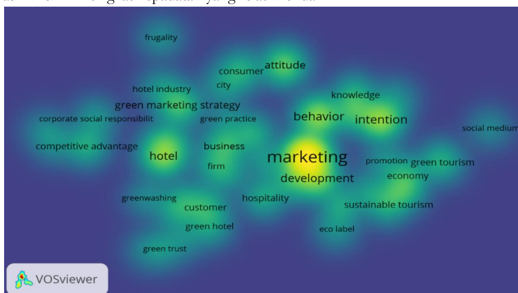
Gambar 3. Density Visualiation

Density visualization Gambar 3, menunjukkan bahwa kata kunci dengan tingkat kepadatan tertinggi adalah green marketing , sustainable tourism , consumer behavior , dan hospitality management . Hal ini menunjukkan bahwa tema tersebut menjadi fokus utama penelitian. Tingginya kepadatan tersebut menunjukkan bahwa tema-tema tersebut menjadi pusat perhatian utama dalam perkembangan penelitian. Selain itu, tema-tema seperti green hotel , environmental sustainability , dan green purchase intention juga menunjukkan tingkat keterhubungan yang cukup tinggi dengan berbagai topik penelitian lainnya. Sementara itu, tema-tema seperti halal tourism sustainability , eco-halal tourism , dan Islamic green tourism masih memiliki tingkat kepadatan yang relatif rendah.