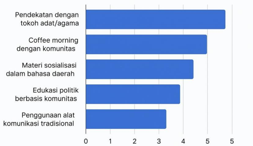
Gambar 2. Strategi Meningkatkan Partisipasi Pemilih

yang sesuai dengan kondisi lokal akan meningkatkan kapasitas mereka dalam menghadapi tantangan. KPU juga perlu memanfaatkan teknologi sederhana, seperti video offline, untuk memastikan informasi dapat diterima oleh masyarakat yang tinggal di daerah dengan akses terbatas. Teori kapabilitas organisasi menekankan bahwa pengembangan sumber daya manusia (SDM) merupakan inti dari adaptasi organisasi terhadap perubahan lingkungan kerja (Ulrich & Lake, 1991). Pelatihan yang disesuaikan dengan konteks lokal membantu petugas pemilu memahami tantangan spesifik, termasuk kendala geografis dan budaya, sehingga mereka dapat bertindak efektif dalam situasi yang kompleks. Prinsip ini sejalan dengan konsep situated learning , yang menyatakan bahwa pembelajaran menjadi lebih efektif apabila berakar di dalam konteks nyata tempat kegiatan berlangsung (Lave & Wenger, 1991). Pelatihan yang sesuai dengan kondisi lokal memungkinkan petugas pemilu untuk menyerap kompetensi yang benar-benar diperlukan di lapangan.