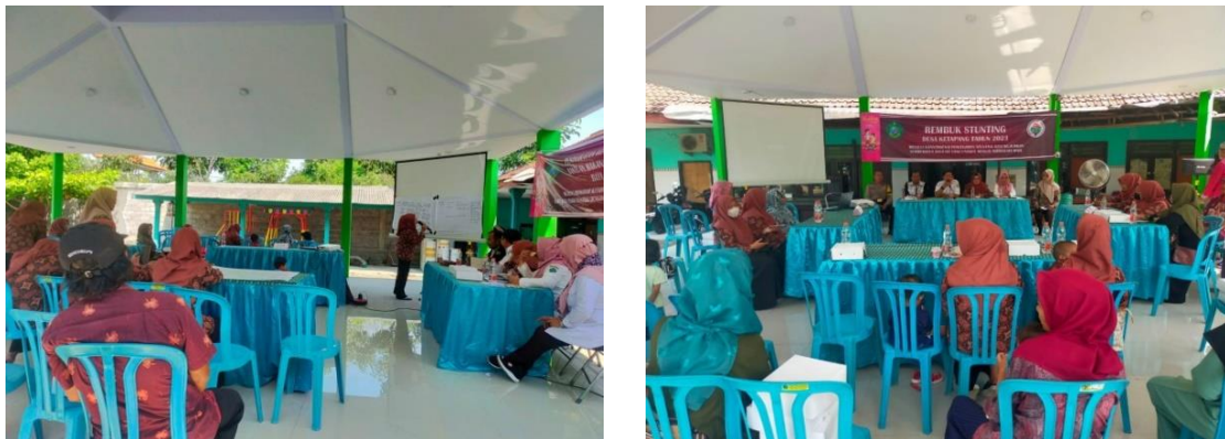
Gambar 4. Pelaksanaan Rembuk Stunting

Berikut merupakan dokumentasi foto Rembuk Stunting antara Pemerintah Desa, RT/RW, Kader posyandu, kader PKK dan Petugas Pelaksana di Desa Ketapang Kecamatan Tanggulangin Kabupaten Sidoarjo.