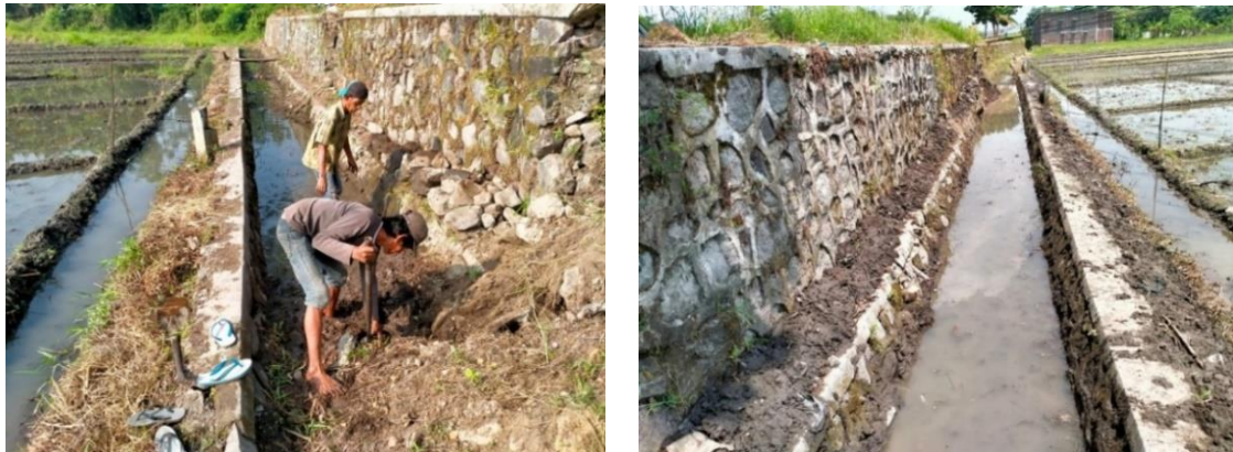
Gambar 7. Pembersihan Saluran Air di Daerah Persawahan dan Pembangunan Jaringan Sumber Daya Air di Desa Ketapang Untuk Menunjang Ketahanan Pangan

Selain itu, bantuan ini juga dapat menjadi bagian dari strategi pemerintah desa untuk mendukung ketahanan pangan lokal dan meningkatkan kesejahteraan petani. Dengan melibatkan petani dalam program pemberian obat-obatan pembasmi hama, diharapkan tercipta sinergi antara pemerintah dan pertanian dalam menjaga keingintahuan lingkungan pertanian. Program ini juga dapat memberikan edukasi kepada petani mengenai manajemen hama yang berkelanjutan dan ramah lingkungan.