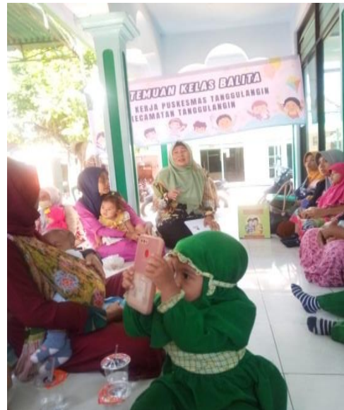
Gambar 8. Sosialisasi oleh Petugas Posyandu di Desa Ketapang