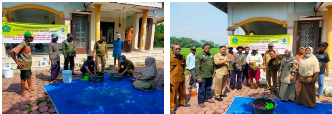
Gambar 6. Bantuan Obat-obatan Pembasmi Hama kepada Petani Desa Ketapang

Bantuan pupuk yang diberikan oleh Pemerintah Desa Ketapang kepada petani di Desa Ketapang bertujuan untuk meningkatkan produktivitas pertanian, mengurangi beban biaya produksi petani, dan mendukung ketahanan pangan di tingkat lokal. Dengan menyediakan pupuk secara subsidi atau bantuan, Pemerintah Desa Ketapang berupaya memastikan akses petani terhadap input pertanian yang penting. Tujuan lainnya meliputi peningkatan pendapatan petani, peningkatan kesejahteraan masyarakat pertanian, dan kontribusi terhadap ketahanan pangan nasional. Pemberian bantuan pupuk juga dapat menjadi strategi untuk mendorong penerapan praktik pertanian yang lebih berkelanjutan dan ramah lingkungan.