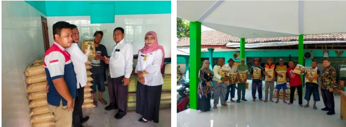
Gambar 5. Bantuan Pupuk kepada Petani Desa Ketapang

Berikut merupakan dokumentasi foto pemberian pupuk kepada petani, pemberian bantuan obat-obatan, pembersihan saluran air di daerah persawahan dan pembangunan jaringan sumber daya air di Desa Ketapang Kecamatan Tanggulangin Kabupaten Sidoarjo.