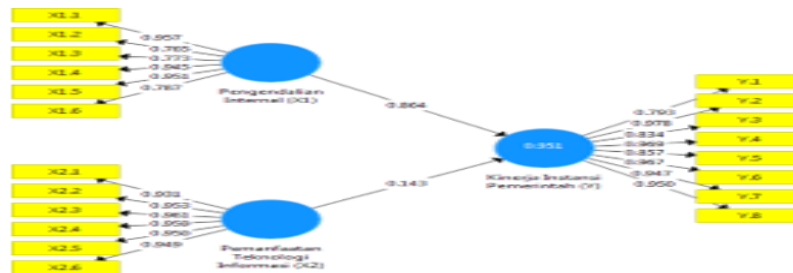
Gambar 4.2 Nilai Loading Factor

Berdasarkan tabel 4.4 di atas, memperlihatkan bahwa masing-masing indikator variable penelitian banyak yang memiliki nilai outer loading > 0.7. Namun terlihat masih terdapat beberapa indikator yang memiliki nilai outer loading < 0.7. Nilai outer loading yang paling tinggi adalah terdapat pada indikator X2.1 sebesar 0.988 sedangkan nilai outer loading yang paling rendah adalah terdapat pada indikator Y2 sebesar 0.980. Berikut adalah gambar 4.2 hasil nilai loading faktor dari validitas konvergen.