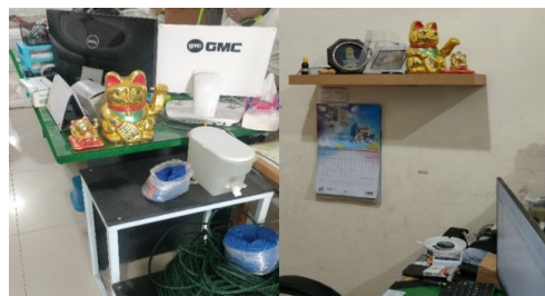
Gambar 3 Maneki-Neko

“kucing-kucing katanya sih ada yang bilang untuk panggil pembeli atau apa, Cuma yah kita ini saja karenakan tangannya yang gerak-gerak.”