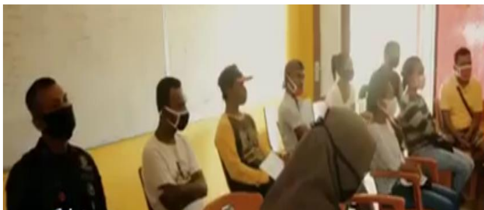
Gambar 1: Peserta Sosialisasi dan Pelatihan PKM

Pengabdian Kepada Masyarakat dilaksanakan pada Sabtu 13 Juni 2020, bertempat di kantor secretariat Orang Muda Katolik (OMK) stasi Langgur, Kabupaten Maluku Tenggara, Provinsi Maluku. Pengabdian ini dihadiri oleh 10 peserta. Keterbatasan peserta dikarenakan situasi pandemi dan wajib menjaga jarak. Kegiatan ini berlangsung selama dua jam dan tiga puluh menit dan berlangsung pada minggu pertama diberlakukan pelonggaran aktivitas. Kegiatan berlangsung dalam 2 tahap yakni kegiatan sosialisasi dan kegiatan pelatihan.