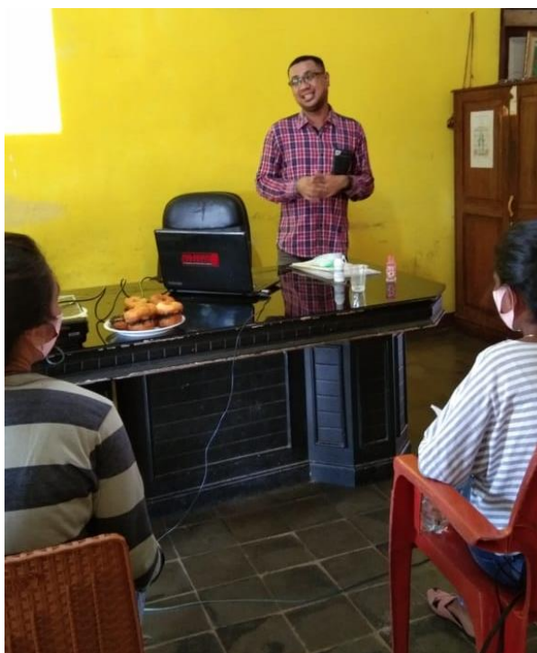
Gambar 6: Pelatihan Pembuatan Hand sanitizer