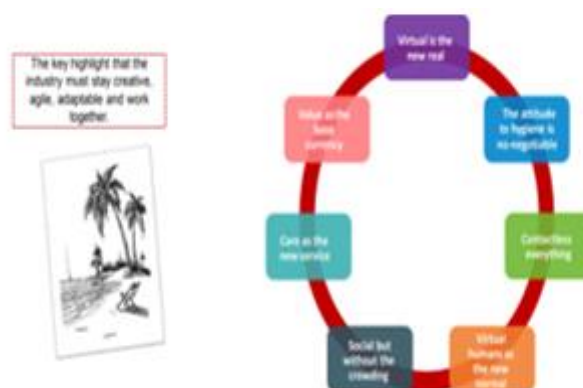
Gambar 4: Materi Prinsip Wisata di Masa Pandemi Covid-19