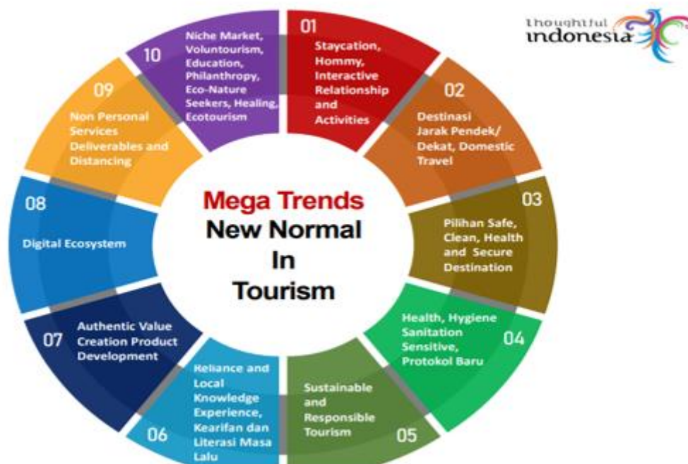
Gambar 5: Materi Sosialisasi: Trend Pariwisata Dimasa New Normal Covid-19