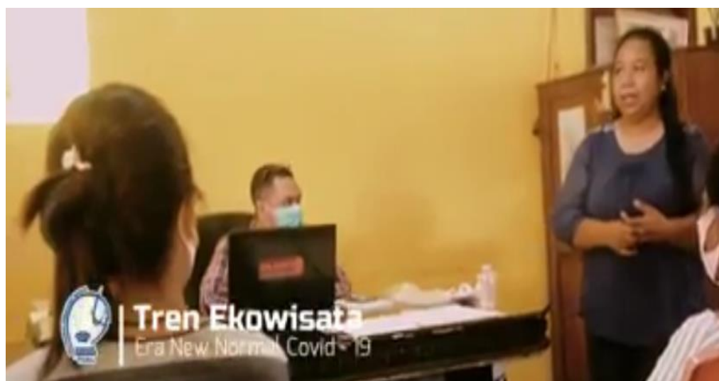
Gambar 2: Pemberian Materi Sosialisasi Trend Ekowisata Di Era New Normal