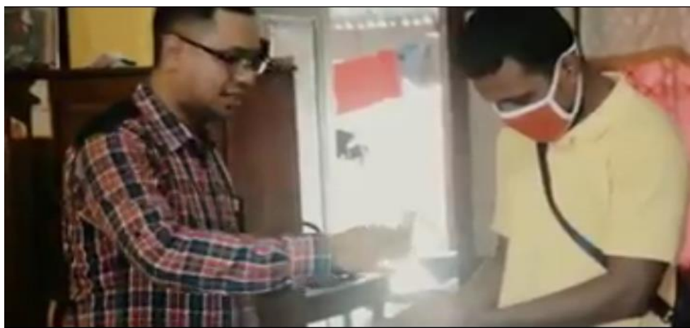
Gambar 7: Pembuatan Hand sanitizer Oleh Peserta

6) Peserta diminta untuk mempraktekan secara mandiri pembuatan hand sanitizer